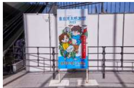
画像は2023年の東京湾大感謝祭 アトリウム入口サイン看板

来場者に配布する (1) プログラムチラシ (2) 会場レイアウトの案内看板 (3) ステージプログラム看板 に社名を掲載いたします。